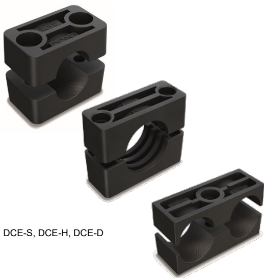
DCE-S, DCE-H, DCE-D